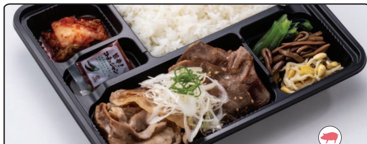
ねぎ塩豚カルビ タン焼き弁当