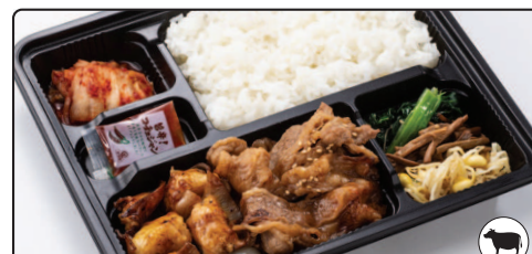
カルビ・ホルモン焼き弁当