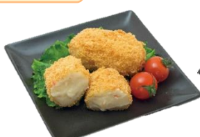
紅ズワイガニクリームコロッケ