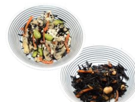
80キロカロリー以下の和惣菜