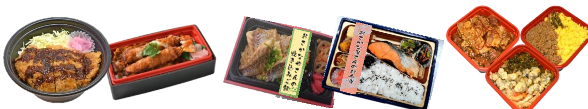
「味噌カツ丼」/「味噌仕立てのエビフライ重」 おさかな屋さんの炊き込みご飯・お弁当

また「一食分、一人分だけ買いたい」「食事は少なめにしたい」というニーズにあわせ、小容量のおにぎりや弁当、「ちいさいおむすび」「ちょこっと丼」などを展開します。