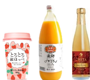
東海イオン限定商品

こだわりのコーヒー豆と世界の食品専門店「カフェランテ」から選りすぐりの商品を展開する「カフェランテ セレクト」コーナーでは、「レイズ」(アメリカ)や「ティムタム」(オーストラリア)、「リンドール」(スイス)など世界で人気のお菓子をはじめ、ブルダックや韓国麺、「辛ダンドントップッキ味スナック」「バターワッフル」など人気の韓国食品を展開します。