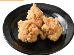
レモン香る！鶏もも竜田揚げ