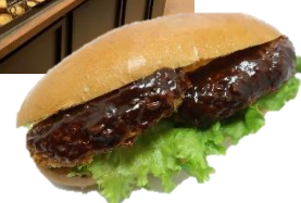
味噌ソースがうまい牛肉コロッケドッグ