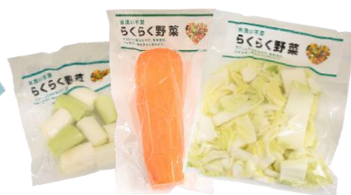
下ごしらえ済みカット野菜