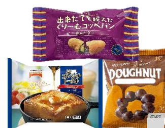
冷凍パン・冷凍スイーツ