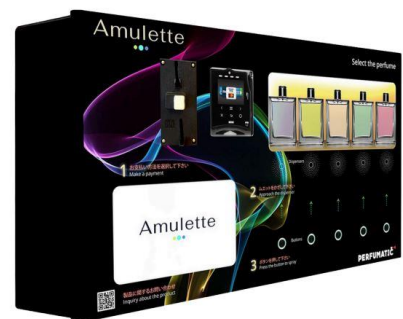
香水の自動販売機