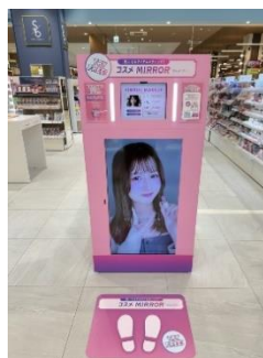
ARバーチャルメイク