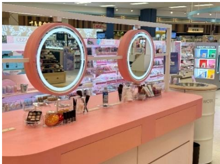
ビューティカウンター

さらに、ラグジュアリーブランドのフレグランスコーナーに、香水を一回単位で試せる自動販売機を導入するほか、理美容家電のお試しコーナーも設けます。