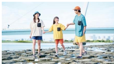
#ワークマン女子 WORKMAN Shoes