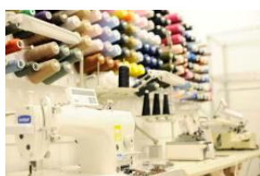
洋服バッグのお直し マジックミシン